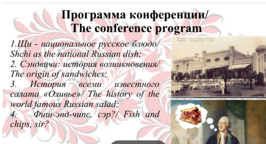
Рис. 2. Программа конференции

Из всего вышесказанного можно сделать вывод о том, что интегрированный урок по теме "Слово и его лексическое значение. Русские фразеологизмы и английские идиомы на примере семантического поля "Еда" позволяет реализовывать концепцию ФГОС ООО в отношении требований к предметным результатам освоения основной образовательной программы учебных предметов "Русский язык" и "Иностранный язык", личностных характеристик выпускника школы: выпускника, знающего русский язык и уважающего свой народ, культуру и духовные традиции с одной стороны, и одно из основных требований к изучению предметной области "Иностранные языки", касающегося приобщения к культурному наследию стран изучаемого языка и воспитания ценностного отношения к иностранному языку как инструменту познания и достижения взаимопонимания между людьми и народами, с другой стороны.