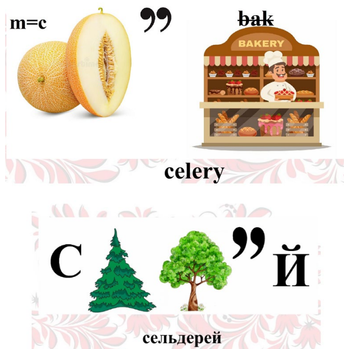
Рис. 1. Ребус к лексической единице «сельдерей»/ “celery”

словарный запас на иностранном языке. Ребусы были составлены специально для данного урока.