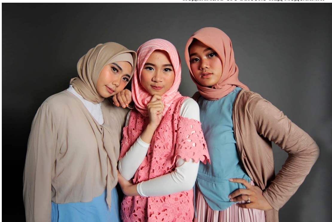
Рис. 4. Следите, чтобы головные уборы, лица, руки не перекрывали свет, падающий на других участников сцены

Однако, эта световая насадка настолько громоздкая и тяжелая, что её крепят на журавль – специальную стойку с грузом-противовесом, которая позволяет вращать источник света и поднимать его высоко над моделями.