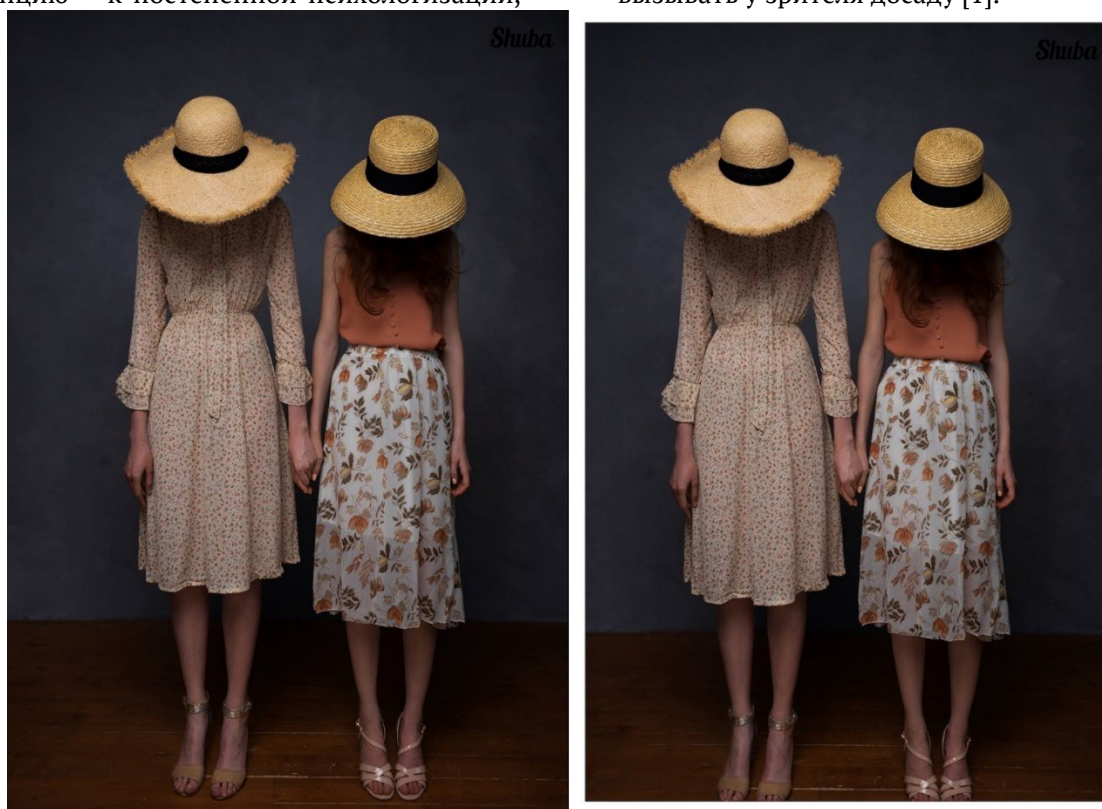
Рис. 1. Слева – оригинальный кадр, справа – пример небрежного кадрирования.

Так, например, если мыотрежем пальцы ног моделям в кадре снизу, это будет выглядеть случайной небрежностью в работе фотографа и вызывать у зрителя досаду [1].