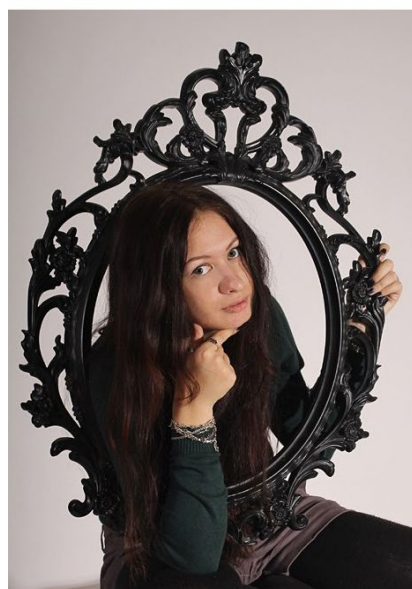
Рис. 6. При помощи кадрирования можно решить проблему неправильного позирования

Наш мозг очень боится увечий. Постарайтесь абстрагироваться от того, что вы это снимали и знаете, что у модели всё хорошо с конечностями. Посмотрите строго: если вам кажется, что у героя кадра руки нет, зрителю это тоже бросится в глаза. Это правило касается не только кадрирования – точно так же оно работает со «спрятанными» из-за позы или предметов на переднем плане частями тела [3].