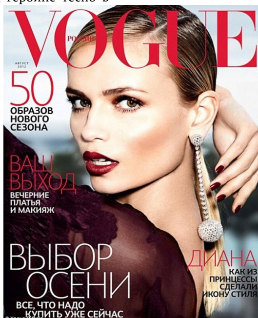
Рис. 4. Обратите внимание на кадрирование рук модели

рамках, она раздвигает их локтями и упёрлась головой. Ей тесно в рамках настолько, что даже вместо лифчика она использует ватман.