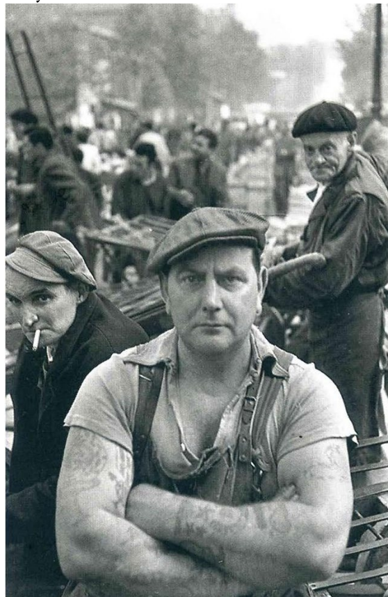
Рис. 2. Мэтры фотографии не стесняются «резать» людей, и вы не стесняйтесь. Фото: Анри-Картье Брессон

или при съёмке в непогоду, зритель простит вам вольное кадрирование, потому что оно может усилить впечатление. Так через плоскую картинку можно передать, какой шел ливень, и что вы снимали, намкнув до нитки за три минуты.