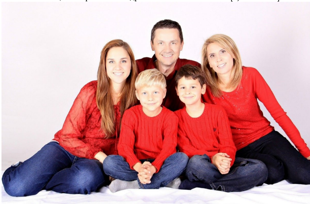
Рис. 2. Головы героев образуют овал

больше трёх человек, то треугольников может быть несколько [2, с. 449-451].