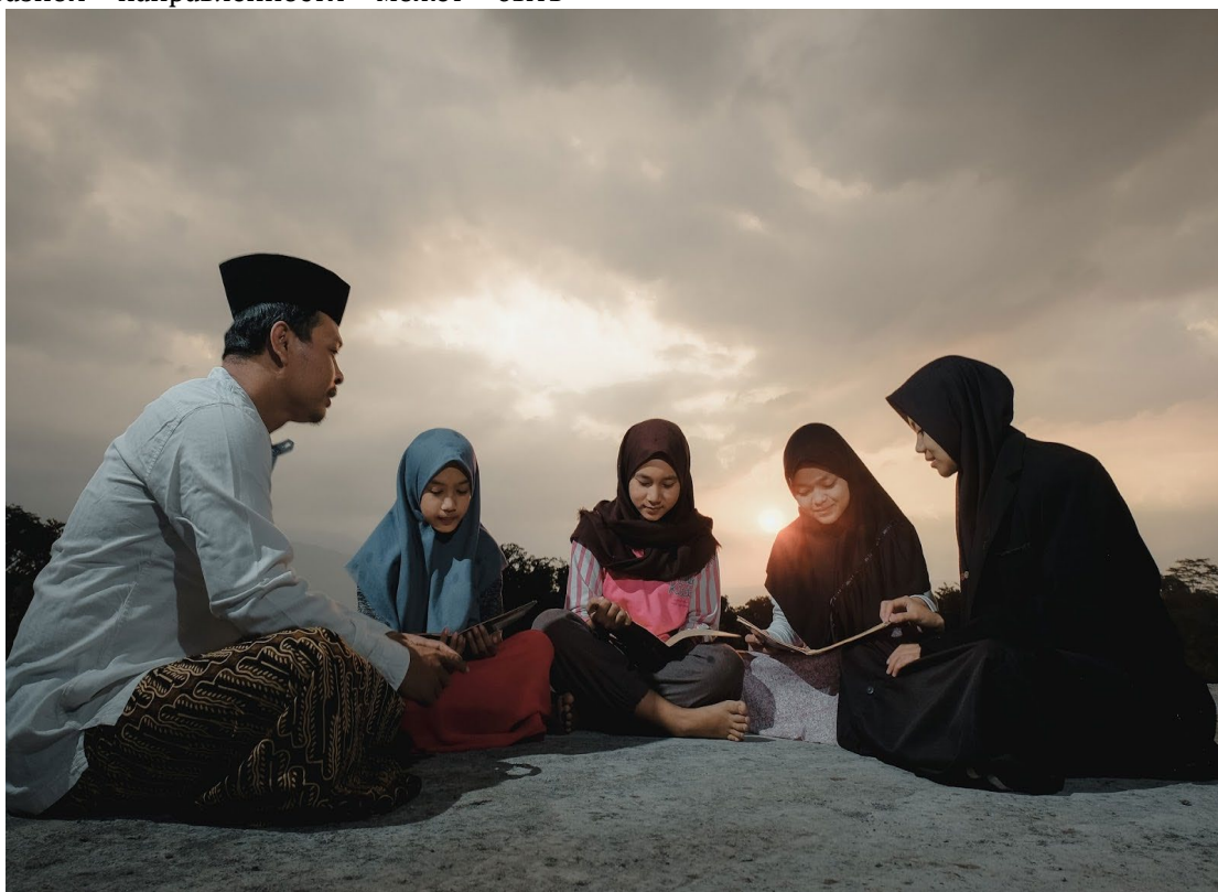
Рис. 3. Две слабо наклонённые диагонали сходятся на модели в центре, формируя клин

несколько. Либо две диагонали могут пересекаться в центре, визуальнo формируя клин. Например, в центре может стоять глава кампании, а по бокам – остальные сотрудники. Либо в центре пара молодоженов, а вокруг – гости.