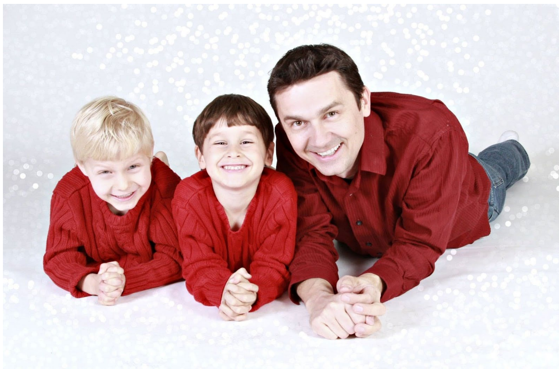
Рис. 5. Серийная съёмка позволяет с большей вероятностью поймать подвижных, эмоциональных детей на семейных съёмках

Если там, где вы снимаете, темно, поставьте более длинную выдержку. Также нельзя недооценивать штатив - он помогает на групповых снимках, где очень много людей и невозможно контролировать каждого. Один моргнет, другой посмотрит в сторону. Поэтому часто приходится «пересаживать» глаза, губы и даже целые головы с одной фотографии на другую. В данном случае штатив обеспечит одинаковый ракурс.