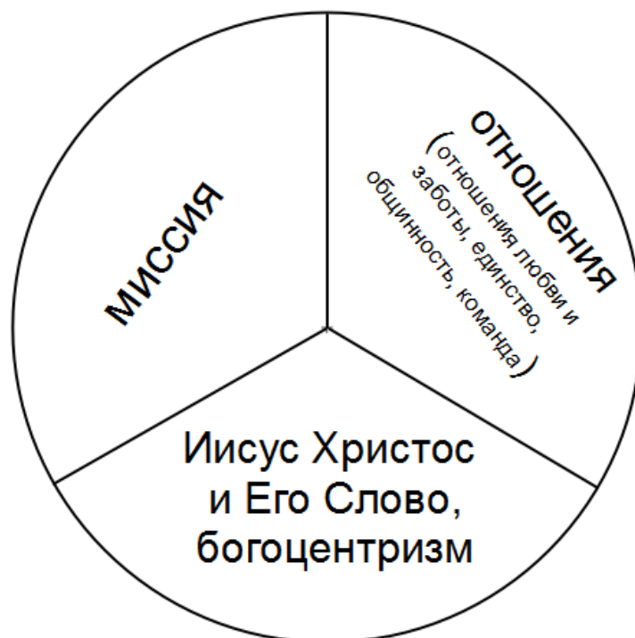
Рис. Модель ДНК основателя