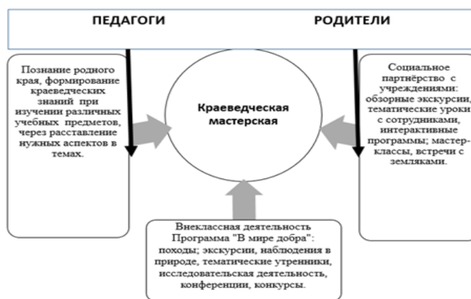
Рис. Педагогический комплекс (модель), направленный на всестороннее изучение родного края в условиях социального партнерства

В начальной школе краеведение не существует как самостоятельная дисциплина, оно эффективно и продуктивно интегрируется с другими учебными предметами. Краеведческий компонент может быть как элементом урока, так и составлять полное содержание всего урока. При отборе краеведческого материала важно придерживаться следующих критериев: доступность и научность информации возрасту обучающихся, историческая и культурная ценность событий для данного края, яркость и эмоциональная насыщенность фактов, возможность совершать наблюдения за окружающей действительностью, способность вызывать интерес к родным местам [1].