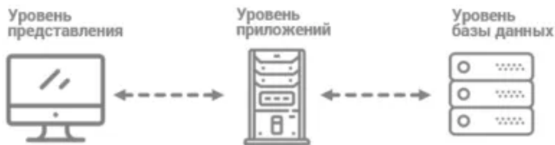
Рис. 1. Общая архитектура ERP-системы

Внедрение современных систем управления, таких как MRP или производственные ERP-системы, становится главным вариантом для успешности малых и средних предприятий, стремящихся к повышению общей эффективности и оптимизации производственных процессов. Эти программные продукты предоставляют платформу для управления всеми аспектами производственных операций, обеспечивая четкое представление о производительности.