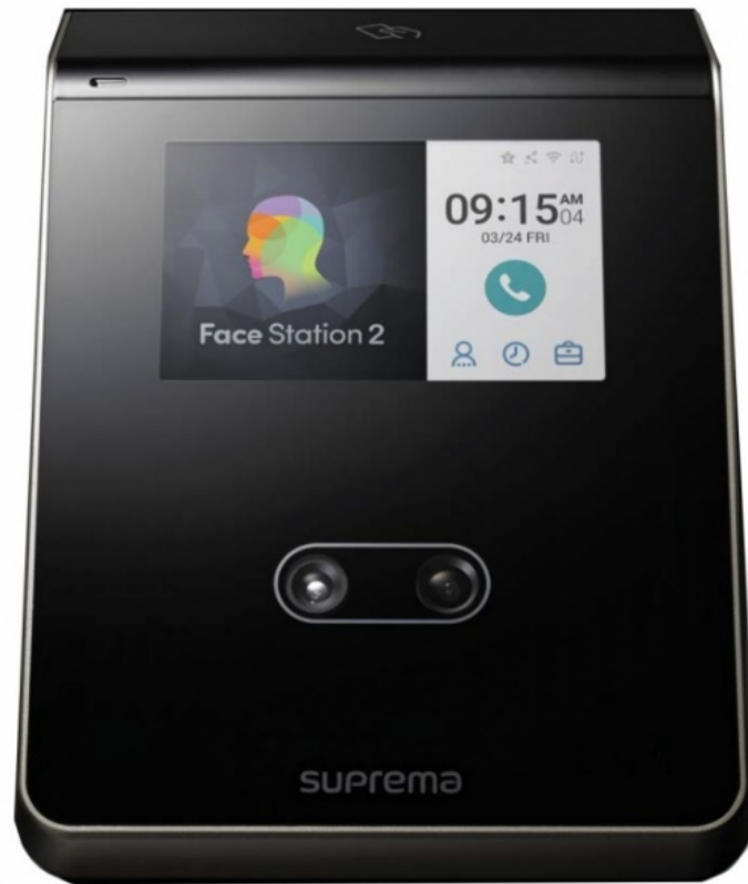
Рис. 1. Терминал Face Station 2

В качестве второго примера можно рассмотреть ProfaceX (рис. 2). ProfaceX – это биометрический терминал с использованием распознавания лиц. Максимальное количество пользователей в данном терминале равно 10000 человек. Отличительной чертой данного терминала