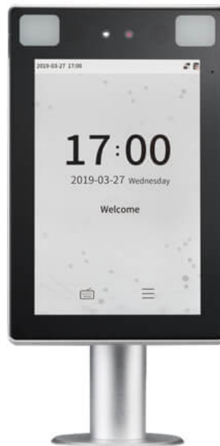
Рис. 2. Терминал ProfaceX

является наличие ультразвукового сенсора, который измеряет расстояние от пользователя до терминала. Данный механизм позволяет экономить вычислительную мощность и не анализировать данные с камеры видеонаблюдения, когда нет пользователя [3].