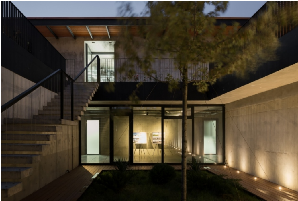
Рис. Внутренний двор винодельни Гай-Кодзор

Ещё одним значимым современным проектом является агротуристический комплекс Винотеррия включающий в себя винодельни Имение Сикоры и Nesterov Winery, экскурсии по производству, дегустационный комплекс, винное спа, банкетный зал, гастробутик и минигостицу Винотеррию [3]. Подобное наполнение производственных предприятий общественными функциями создает дополнительный потенциал для развития агротуризма.