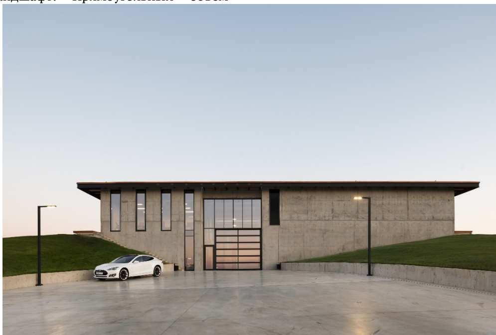
Рис. 2. Винодельня Гай-Кодзор

здания вписывается в холмистую местность, создавая комфортные условия для производства вина. В центральной части винодельни расположен оазис с редкими растениями [3].