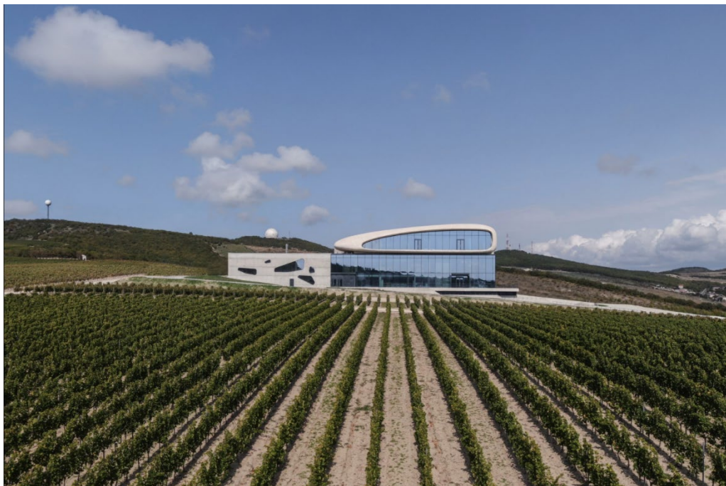
Рис. 1. Винодельня Cote Rocheuse («Скалистый берег»)

Еще одним примером современной винодельни является винодельня Гай-Кодзор (рис. 2). Архитектурный облик этого сооружения также продиктован местностью. Большую роль играет ландшафт. Прямоугольный объем