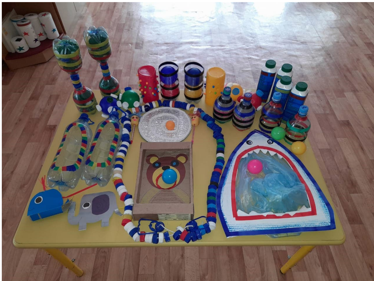
Рис. Нестандартное физкультурное оборудование

оздоровительной работы. Поэтому оно никогда не бывает лишним. Можно без особых затрат обновить игровой инвентарь в спортивном зале (рис.).