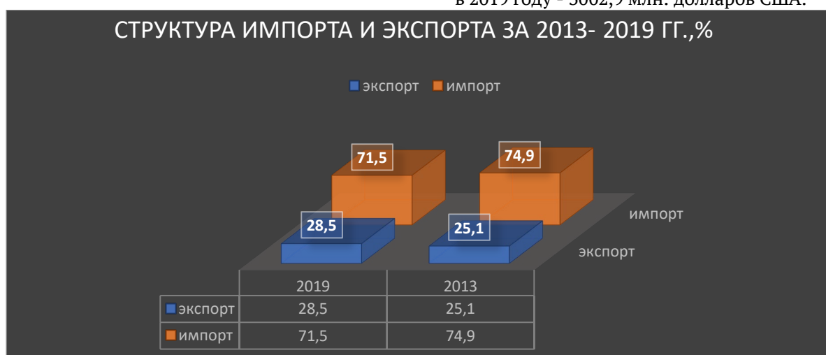
Рис. 1. Структура импорта и экспорта за 2013- 2019 гг., %

Восстановление внешней торговли Кыргызской Республики началось с 2017 года, показателем этого стало увеличение объема экспорта в системе внешнеэкономической деятельности и снижение дефицита торгового баланса - в 2013 году составлял 3980,2 млн. долларов США, в 2019 году - 3002,9 млн. долларов США.