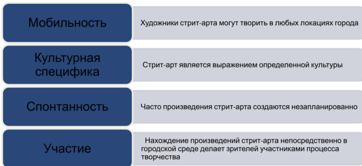
Рис. 2. Характеристики стрит-арта

Основные характеристики стрит-арта как искусства представлены на рис. 2.