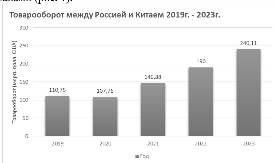
Рис. 1. Товарооборот между Россией и Китаем 2019–2023 гг. (составлено авторами по: [1])

Политика «Один пояс и один путь» активно реализуется, укрепляя китайско-российские отношения и способствуя быстрому развитию торговли между странами (рис. 1).