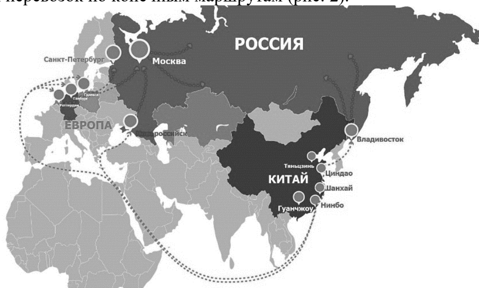
Рис. 2. Схема морских транспортных маршрутов до 2022 г. [3, с. 9]

Ранее морские грузоперевозки из Китая в Россию включали выгрузку в базовых европейских портах, таких как Гамбург и Роттердам, а затем транспортировку в Санкт-Петербург, что обычно занимало около 50 дней с учетом коротких перевозок по конечным маршрутам (рис. 2).