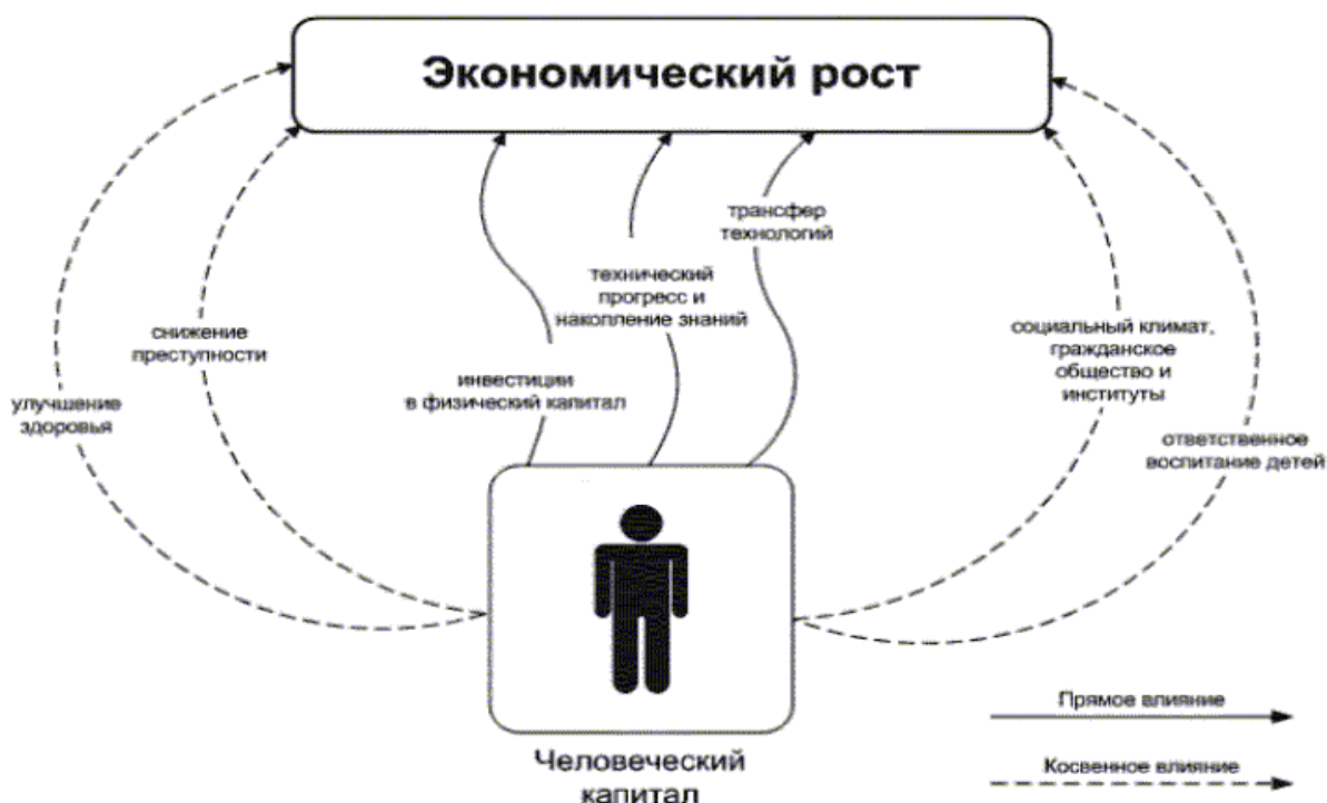
Рис. Влияние национального человеческого капитала на развитие экономики [1]

лать... Но гораздо интереснее жить думая, задавать себе разные вопросы и искать на них ответы» [3, с. 177].