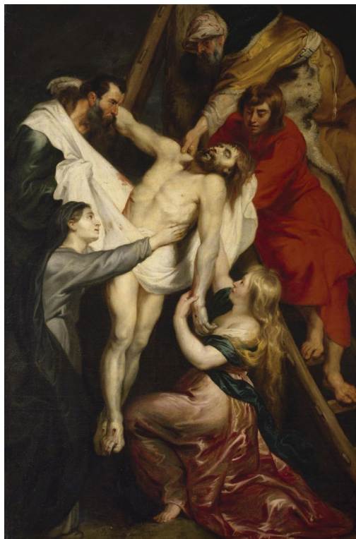
Рис. 1. Питер Пауэл Рубенс. Снятие с креста. Ок.1617-1618. Холст, масло. 297 x 200 см. Государственный Эрмитаж, Санкт-Петербург

западноевропейской живописи и вбирая в себя силу и выразительность прихотливого в приемах барокко, превращает патетическое религиозное полотно в пространство личных переживаний, членимое на пеструю палитру «микротем». Казалось бы, алтарное изображение, имеющее исключительно «прикладную» значимость, вырастает до масштаба истории, обладающей драматической плотностью и напряженностью.