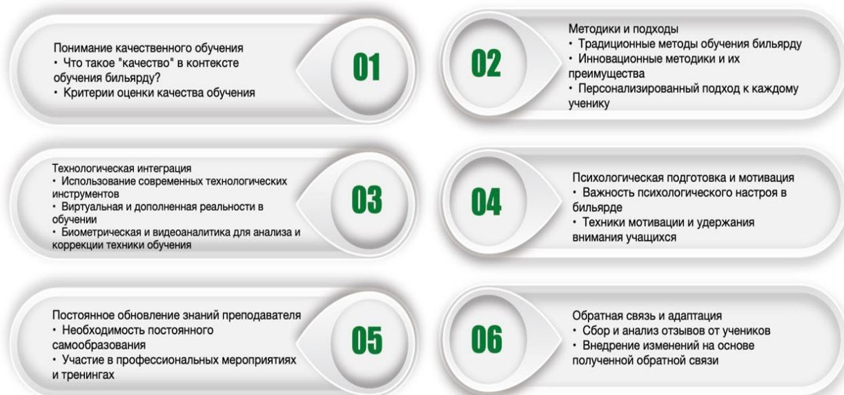
Рис. 2. Понимание целостного подхода к обучению

Важнейшим аспектом качественного обучения является способность создавать среду обучения, которая является одновременно стимулирующей и адаптивной. В этом контексте крайне важно адаптировать методики преподавания с учетом индивидуальных особенностей учащихся. Понимание того, что каждый студент обладает уникальным сочетанием предыдущего опыта, предпочтений в обучении и конечных целей, позволяет разрабатывать стратегии обучения, которые находят отклик на личном уровне. Такой индивидуальный подход не только ускоряет приобретение навыков, но и воспитывает у студентов чувство сопричастности и вовлеченности.