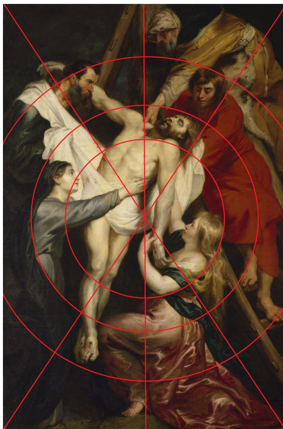
Рис. 3. Питер Пауэл Рубенс. Снятие с креста. Ок.1617-1618. Холст, масло. 297 x 200 см. Государственный Эрмитаж, Санкт-Петербург. Радиально-кольцевая композиция и оптический центр