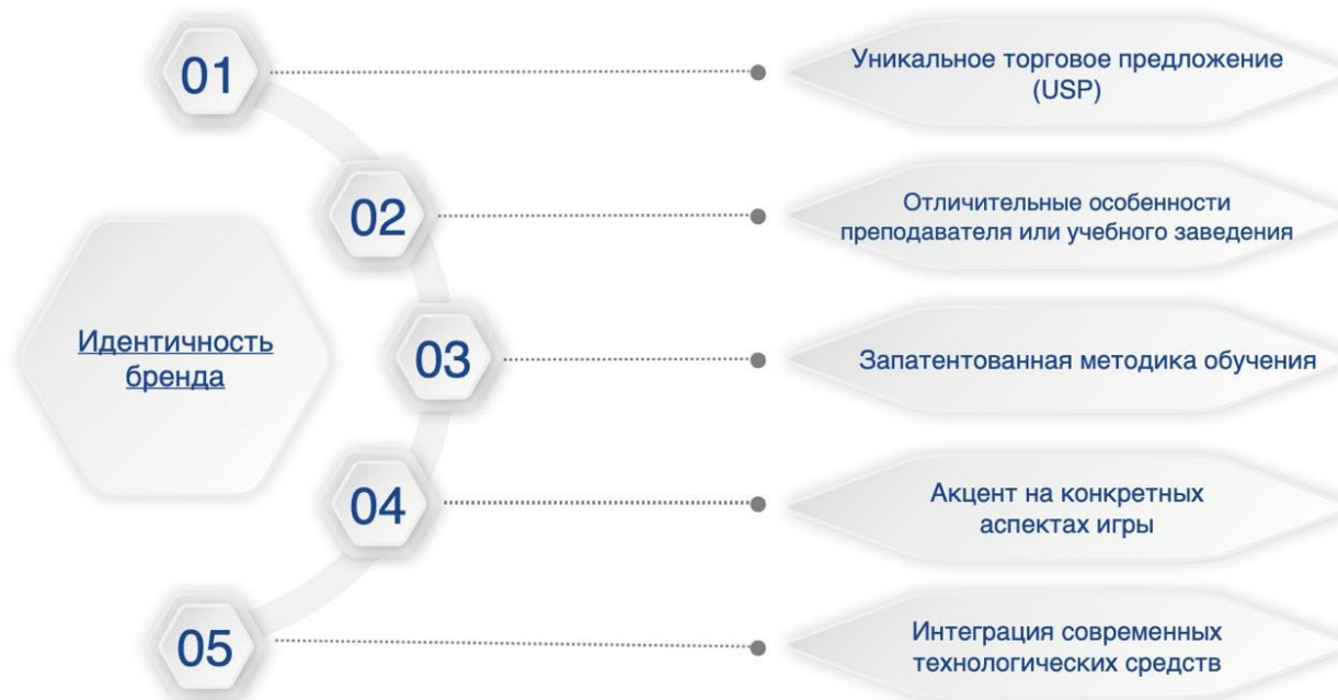
Рис. 1. Основные составляющие идентичности бренда

Визуальное представление, еще один важный пункт фирменного стиля, играет решающую роль в мгновенном узнавании и отзыве. От дизайна логотипа до тематических цветовых схем - все эти визуальные элементы должны быть тщательно проработаны, чтобы найти отклик у целевой аудитории и в то же время передать суть бренда. Такая визуальная идентичность, когда она согласована на различных платформах - будь то веб-сайт, обучающие видеоролики или рекламные материалы, - помогает укрепить доверие и лояльность среди студентов.