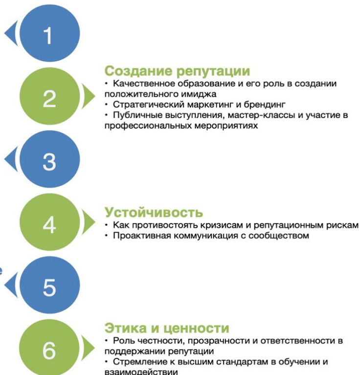
Рис. 3. Основные составляющие в создании репутации

Преподаватели должны оставаться верными своей философии преподавания и ценностям, гарантируя, что каждое взаимодействие, будь то личное или виртуальное, основано на искренности и честности. Аутентичность способствует доверию, что является фундаментальным компонентом в построении прочных отношений как со студентами, так и с заинтересованными сторонами.