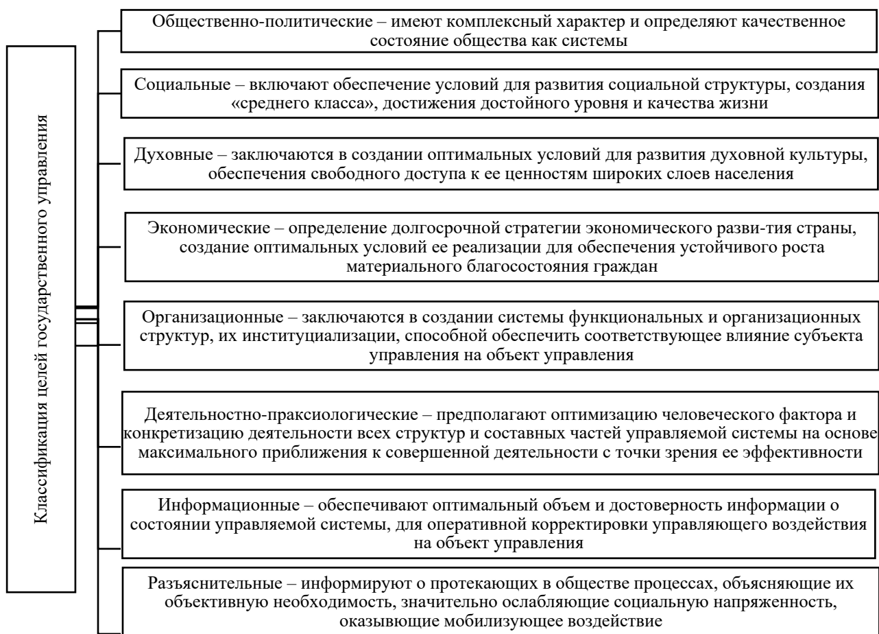
Рис. 1. Цели государственного управления [3, с. 101-103]

Помимо основной цели государство выдвигает множество иных значимых целей – их классификация отражена на рисунке 1.