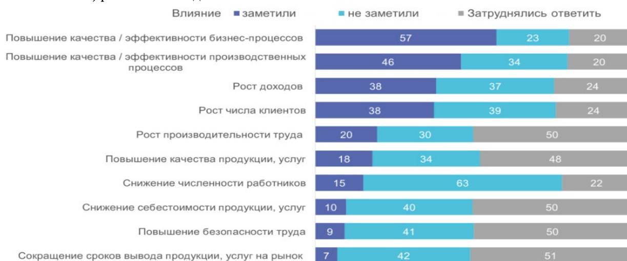
Рис. 3. Оценка результатов внедрения и использования технологий искусственного интеллекта в организации: 2024 (в % от числа организаций, использующих технологии ИИ) [7]

Технологии искусственного интеллекта в России применяются преимущественно в операционных бизнес-процессах: маркетинге и продажах (52%), производстве и оказании услуг (51%), управлении персоналом (51%). При этом в стратегически важных и сложных областях, таких как управление организацией, обеспечение безопасности и логистика, уровень внедрения ИИ остаётся низким (15–23%). Это указывает на то, что российский бизнес находится на начальном этапе цифровой трансформации, используя ИИ преимущественно для решения тактических задач с быстрой окупаемостью, тогда как потенциал технологий для стратегического управления и оптимизации комплексных процессов (включая управление денежными потоками) реализован недостаточно.