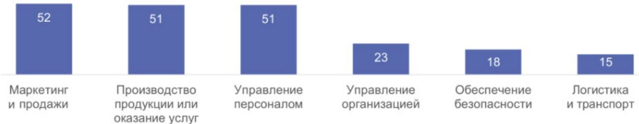
Рис. 2. Использование технологий искусственного интеллекта в бизнес-процессах организаций: 2024 (% от числа организаций, использующих технологии ИИ) [7]

«Искусственный интеллект может использоваться в различных бизнес-процессах. Свыше половины компаний, работающих с ИИ-технологиями, отметили их применение в маркетинге и продажах, производстве продукции и оказании услуг, управлении персоналом. Значительно реже технологии ИИ востребованы в управлении организацией, обеспечении безопасности, логистике и транспорте» (рис. 2) [7].