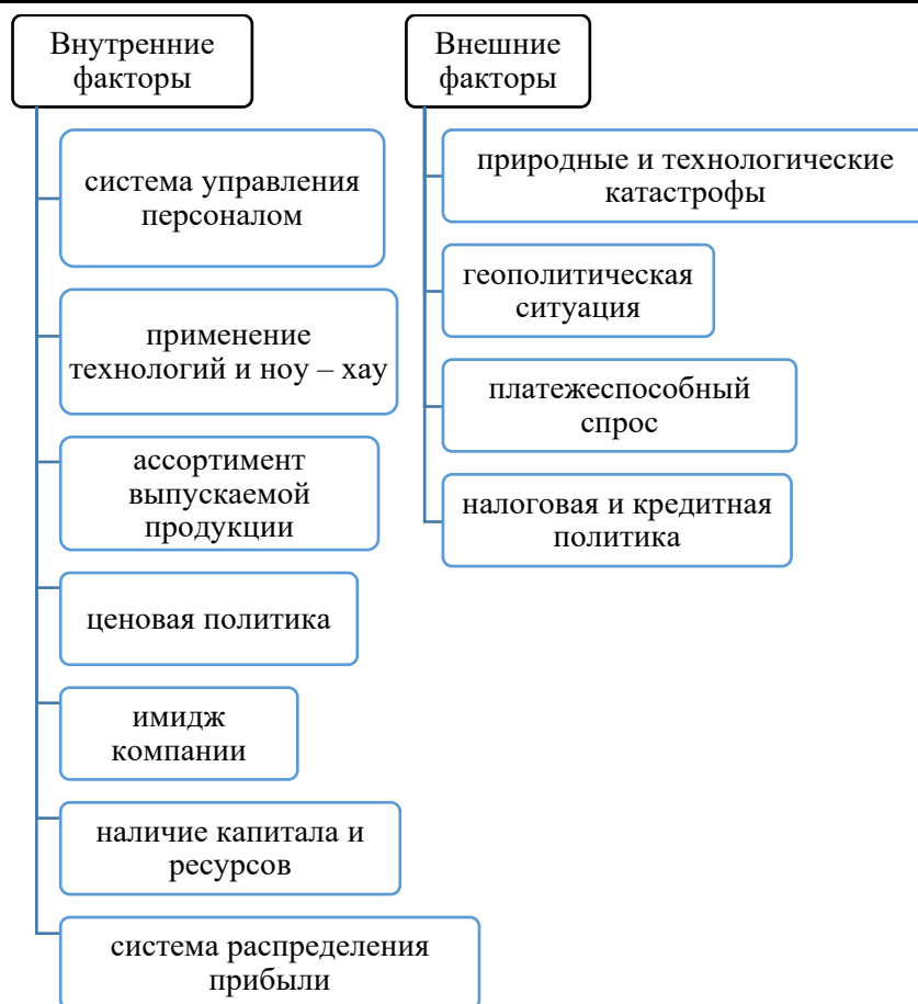
Рис. 2. Внутренние и внешние факторы, оказывающие влияние на эффективность деятельности предприятия

Рассмотрены теоретические аспекты эффективности деятельности предприятий. По результатам исследования был сделан вывод о том, что повысить эффективность деятельности в целом возможно только при условии слаженного и эффективного использования ресурсной базы субъекта хозяйствования, в связи с чем, необходимость совершенствования методических подходов системы управления ресурсной базой в нестабильных экономических и геополитических условиях предстает актуальной задачей. Управление предприятиями основано на эффективном использовании ресурсного потенциала в рамках корреляции организационного и экономического аспекта управленческой деятельности.