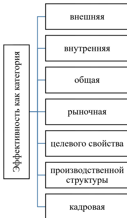
Рис. 1. Классификация эффективности как категории

Рыночная эффективность по сути своей отражает количество проданного товара по отношению к затраченным усилиям.