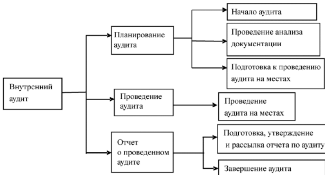
Рис. Схема проведения внутренних аудитов в ООО «Карьерные Машины»

программой на текущий год; в виде специальных проверок, проводимых по определенным причинам для выполнения конкретных целей. Результаты проверок используются руководством для совершенствования деятельности ООО «Карьерные Машины» путем разработки и осуществления комплекса мероприятий по сокращению, устранению и предотвращению повторения выявленных несоответствий.