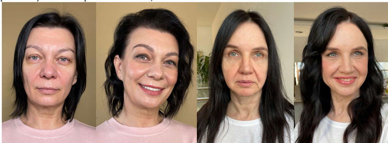
Рис. 2. Клиентки ДО и ПОСЛЕ макияжа

Один из наиболее результативных способов в установлении доверия клиента к новому для него визажисту является наличие профессионального макияжа на лице самого визажиста. Если клиент при встрече с визажистом сразу видит качественный и гармоничный макияж, то он с большей долей вероятности доверяет мастеру (рис. 2).