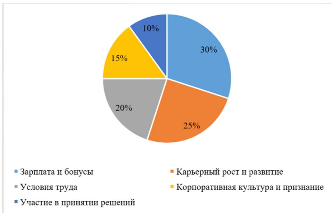
Рис. 1. Влияние различных факторов на мотивацию персонала ресторанного бизнеса

Влияние различных факторов на мотивацию персонала ресторанного бизнеса изображено на рисунке 1.