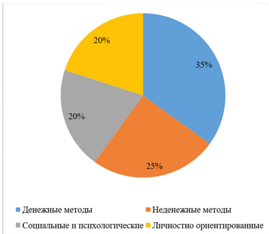
Рис. 2. Влияние методов мотивации на производительность персонала

Влияние методов мотивации на производительность персонала показано на рисунке 2.