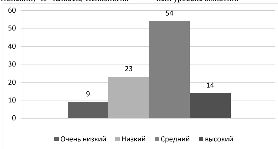
Рис. 1. Результаты исследования уровня эмпатии первокурсников

Как видно из диаграммы, представленной на рисунке 1 очень низкий уровень эмпатии выявлен у 9% студентов; низкий уровень у 23%; средний уровень у 54% студентов; высокий уровень у 14% опрошенных. Полученные данные свидетельствуют о том, что у исследуемой группы первокурсников преобладает адекватный уровень эмпатии.