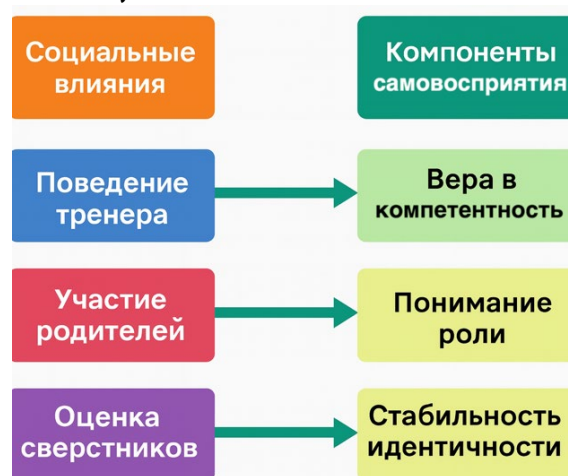
Рис. 2. Взаимодействие социальной среды и компонентов самовосприятия спортсмена

На рисунке 2 указаны основные социальные влияния и показано, как они трансформируются в ключевые компоненты спортивного самовосприятия – уверенность в собственной компетентности, понимание своей роли и стабильность идентичности.