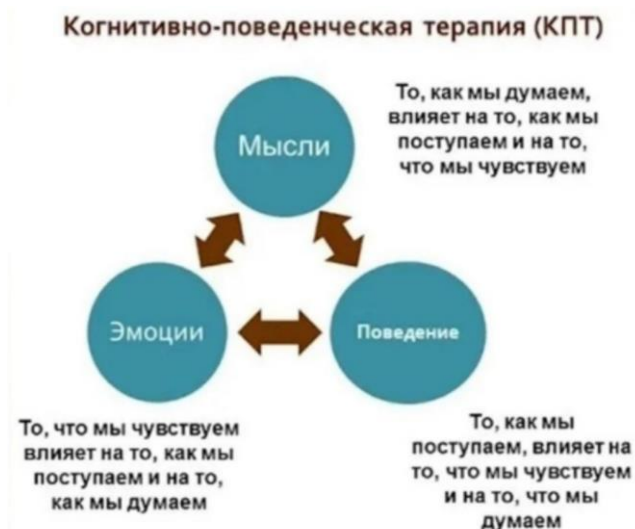
Рис. 1. Основы когнитивно-поведенческой терапии [2]

Для предпринимателей это означает устранение распространенных когнитивных искажений, таких как катастрофизм («Если эта сделка сорвется, мой бизнес рухнет») или мышление «все или ничего» («Я должен добиться успеха немедленно, иначе я неудачник»). Участники обучающих семинаров сообщили о заметном улучшении своей способности переосмысливать подобные мысли. Например, предприниматель, который ранее не решался запускать новый продукт из-за боязни быть отвергнутым, научился воспринимать неудачи как возможности для роста. Этот сдвиг в перспективе не только снизил тревожность, но и ускорил принятие решений и внедрение инноваций [5].