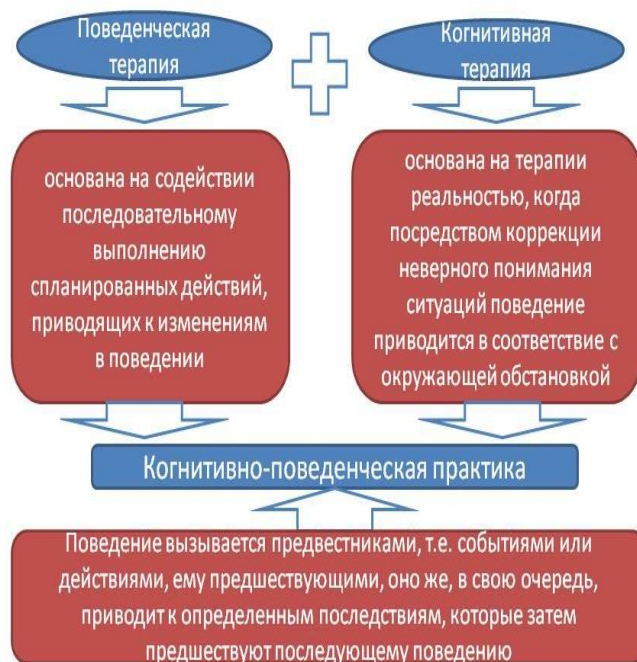
Рис. 2. Составляющие когнитивно-поведенческой практики [5]

Предприниматели часто работают в условиях повышенного давления, а стрессовые факторы варьируются от финансовой неопределенности до межличностных конфликтов. Если их не контролировать, эти стрессовые факторы могут подорвать концентрацию, повлиять на суждения и привести к эмоциональному выгоранию. КПТ предлагает практические инструменты для регуляции эмоций, такие как медитация осознанности и постепенное расслабление мышц. Данные методы можно условно разделить на 2 основные группы, что можно объяснить тем, что КПТ состоит из поведенческой и когнитивной терапией, как изображено на рисунке 2.