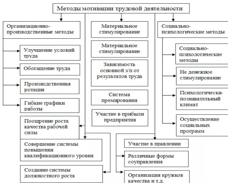
Рис. 2. Методы мотивации

Методы мотивации можно разделить на две группы (рис. 2):