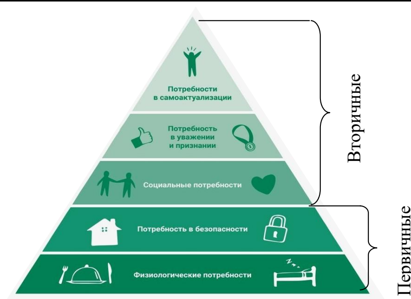
Рис. 1. Пирамида А. Маслоу

Данное учение внесло важный вклад в понимание того, что находится в основе стремления людей к работе. Руководители различных рангов стали понимать, что мотивация людей определяется широким спектром их потребностей. Для того чтобы мотивировать конкретного человека, руководитель должен дать ему возможность удовлетворить его важнейшие потребности. Руководитель должен постоянно и тщательно наблюдать за своими