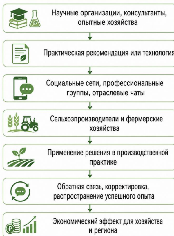
Рис. Модель трансфера знаний через социальные сети в агробизнесе (разработка автора)

Модель трансфера знаний через социальные сети в агробизнесе изображена на рисунке ниже.