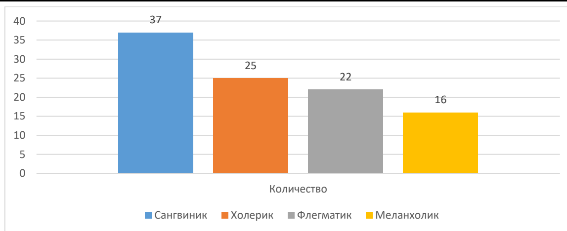
Рис. 1. Типы темперамента подростков, %

Сангвиники составляют 25% группы, характеризуются высокой социальной активностью и легко находят общий язык с окружающими. Они занимают более высокие социальные позиции, такие как «предпочитаемые» или «лидеры».