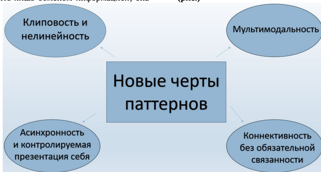
Рис. Новые черты паттернов

Новые черты паттернов приведены ниже (рис.)