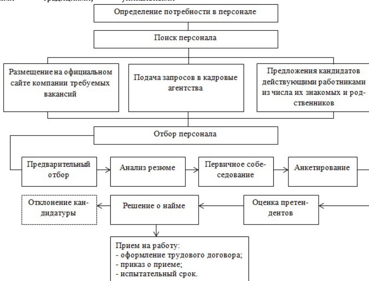
Рис. 1. Процесс отбора персонала

Концепция отбора персонала. Департамент кадров, даже при ограниченном персонале, должен иметь четко определенную стратегию отбора персонала и обеспечивать доступ к соответствующим инструментам для ее реализации. Концепция отбора персонала тесно связана с официально объявленными и публично продвигаемыми целями и стратегиями деятельности фирмы (организации), а также с ее корпоративной культурой (представлено на рисунке 1) [9, с. 58].