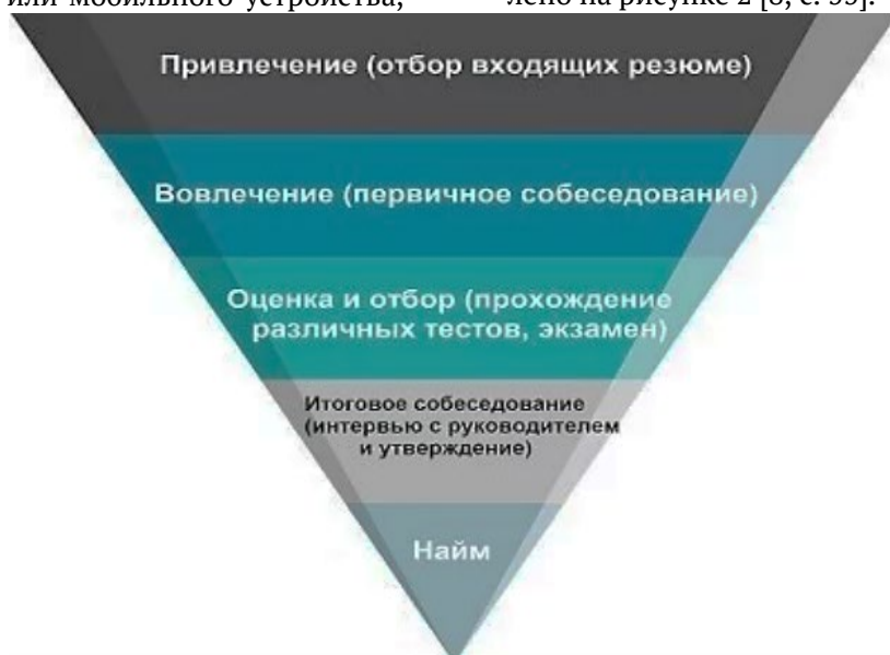
Рис. 2. Классическая воронка отбора персонала

Этот аналитический инструмент позволяет структурировать и систематизировать процесс найма, разбивая его на несколько ключевых этапов. Стандартная модель «воронки найма» представляет из себя графическое изображение, включающее пять основных стадий: от привлечения кандидатов до окончательного выбора наиболее подходящих специалистов для внедрения в организацию, что представлено на рисунке 2 [8, с. 55].