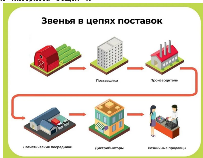
Рис. 2. Ключевые звенья цепи поставок

Особое внимание в предпринимательской практике уделяется управлению логистическими рисками. Современные цепи поставок подвержены как внешним рискам, связанным с макроэкономическими и политическими факторами, так и внутренним рискам, обусловленным неэффективной организацией процессов, низким уровнем цифровой зрелости и кадровыми ограничениями. Предпринимательские модели управления supply chain ориентированы на выявление критических точек, диверсификацию маршрутов, создание резервных мощностей и использование прогнозной аналитики.