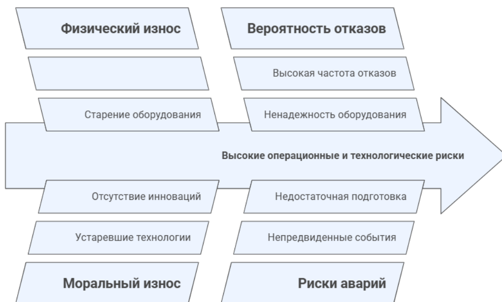
Рис. 2. Риски в электроэнергетике

Формирование рискового профиля энергетических компаний осуществляется под воздействием факторов различной природы, часть из которых определяется внешней средой и не поддаётся прямому управленческому воздействию. К данной группе относятся рыночные колебания, изменения регуляторных режимов и макроэкономические сдвиги, задающие институциональные и экономические рамки деятельности компаний. В противоположность этому внутренние источники рисков формируются в пределах самой организации и обусловлены состоянием производственных активов, особенностями операционных процессов, качеством управленческих решений и