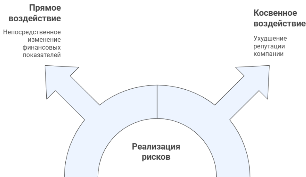
Рис. 3. Влияние рисков на финансовые показатели компании

Реализация указанных рисков трансформируется в финансовые последствия многоуровневым образом. Наряду с непосредственным влиянием на показатели выручки, затрат и финансового результата, существенное значение приобретают опосредованные эффекты, проявляющиеся в снижении репутационного капитала, ухудшении условий заимствования и росте стоимости привлекаемых ресурсов. Именно данные косвенные последствия во многом определяют устойчивость бизнеса в долгосрочной перспективе и его инвестиционную привлекательность (рис. 3).