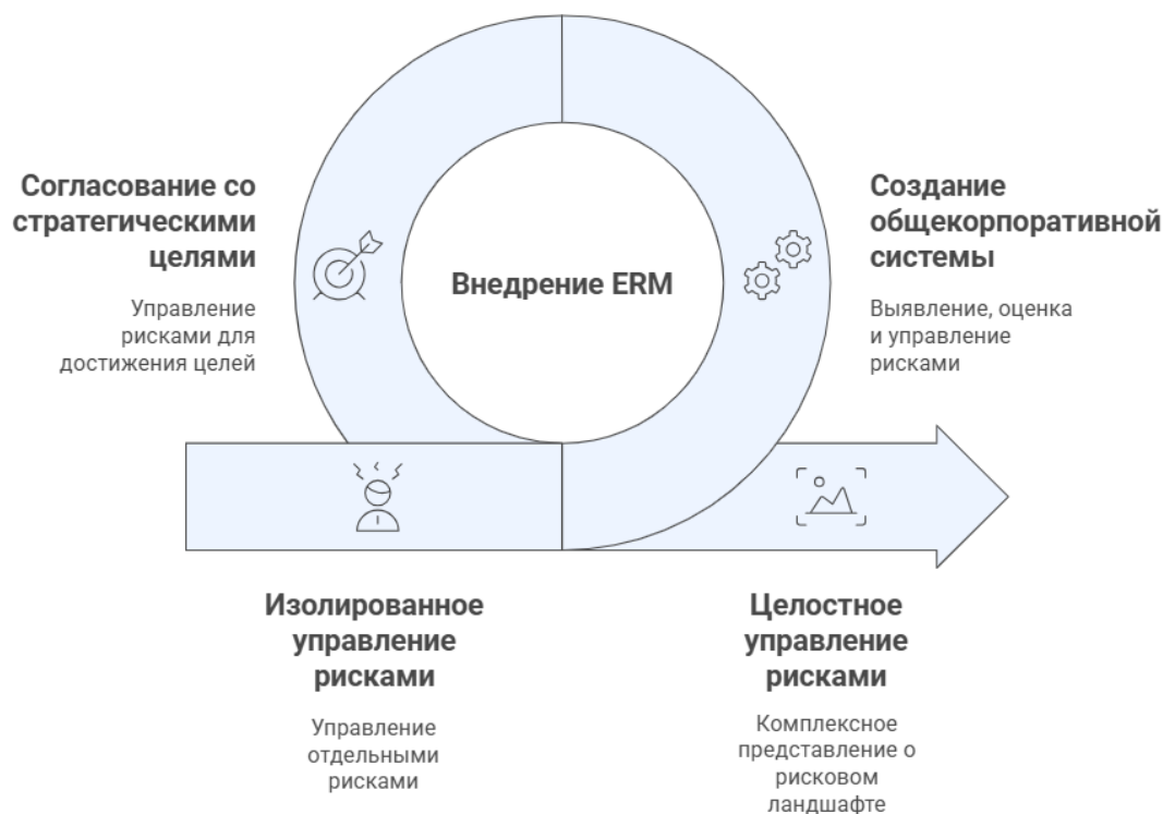
Рис. 1. Переход к интегрированному риск-менеджменту

моделей риск-менеджмента, предполагающих распределение ответственности между отдельными функциональными подразделениями, ERM ориентирована на формирование единого корпоративного механизма координации, обеспечивающего целостное восприятие рискового профиля организации (рис. 1).