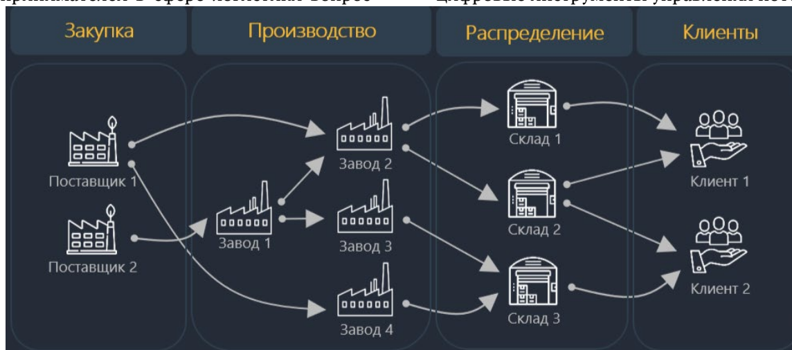
Рис. 1. Ключевые факторы устойчивости управления цепями поставок в условиях глобальной нестабильности

Глобальные изменения в мировой экономике приводят к трансформации традиционных моделей логистики. Устойчивость цепей поставок сегодня определяется не столько масштабами деятельности компании, сколько ее способностью адаптироваться к внешним шокам, оперативно перестраивать маршруты, диверсифицировать поставщиков и внедрять цифровые инструменты управления потоками.