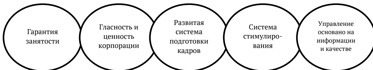
Рис. 1. Особенности японского управления стимулированием труда

На сегодняшний день система пожизненного найма в классическом виде применяется лишь на некоторых крупных предприятиях и на государственной службе. Особенности японского менеджмента, показывающие его гибкость, представлены на рисунке 1 [4, с. 48].