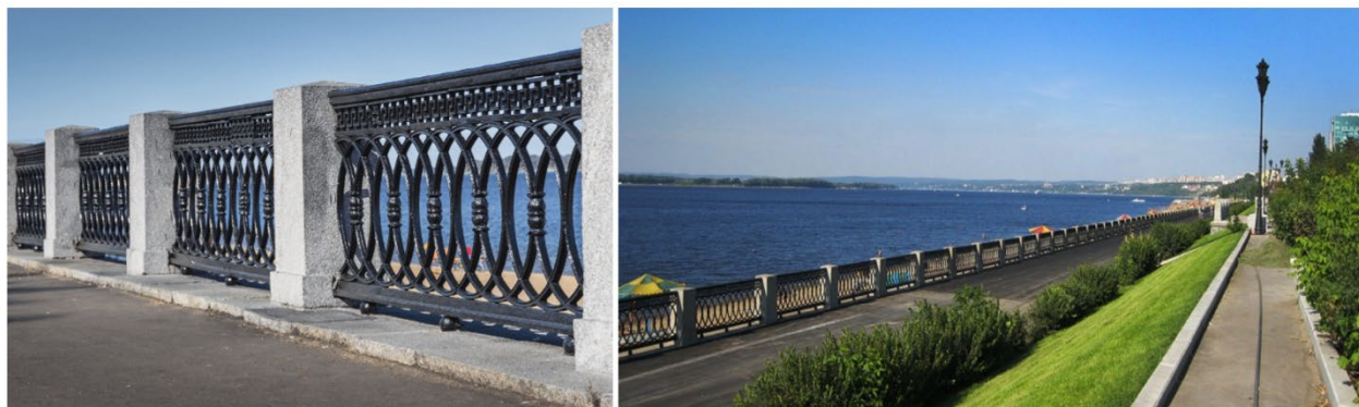
Рис. 5. Чугунное ограждение на набережной Волги г. Самары

волжских городов, но также и чугунными ограждениями на набережной Волги (рис. 5).