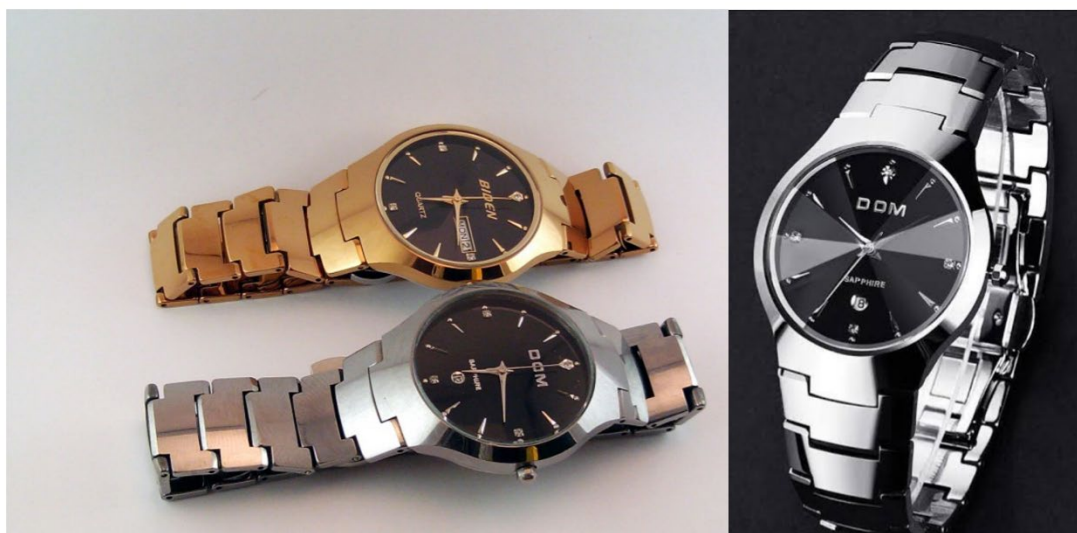
Рис. 13. Швейцарские часы из карбида вольфрама

сопоставимое с алмазом. При этом использование дополнительно покрытия значительно расширяет цветовую гамму: покрытие цирконием или золотом придает золотистый тон, метод осаждения ионов зачерняет украшение (рис. 13).