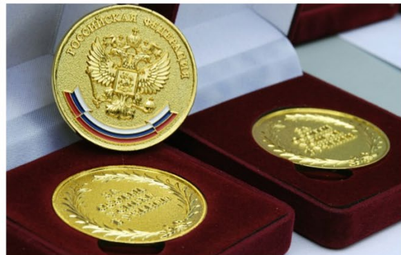
Рис. 6. Золотая медаль «За особые успехи в обучении» по окончании школы

Бронзы представляют собой двойные или многокомпонентные сплавы меди с другими металлами, которые позволяют улучшать основные свойства сплава. При изготовлении