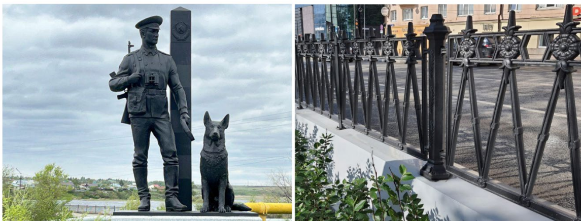
Рис. 3. Художественные изделия, изготовленные на Каслинском чугуноплавильном заводе

Тульский предприниматель Илларион Лугинин - основатель Кусинского завода. Лучшие образцы художественного Кусинского литья стали выпускаться с 1946 года. Появились отливки, увековечившие в чугуне образы Ленина, Сталина, Кирова, Пушкина, Горького и других выдающихся людей (рис. 4). К сожалению, в