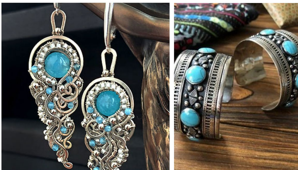
Рис. 9. Ювелирные украшения из мельхиора

прекрасные украшения с применением таких техник, как финифть и филигрань (рис. 9).