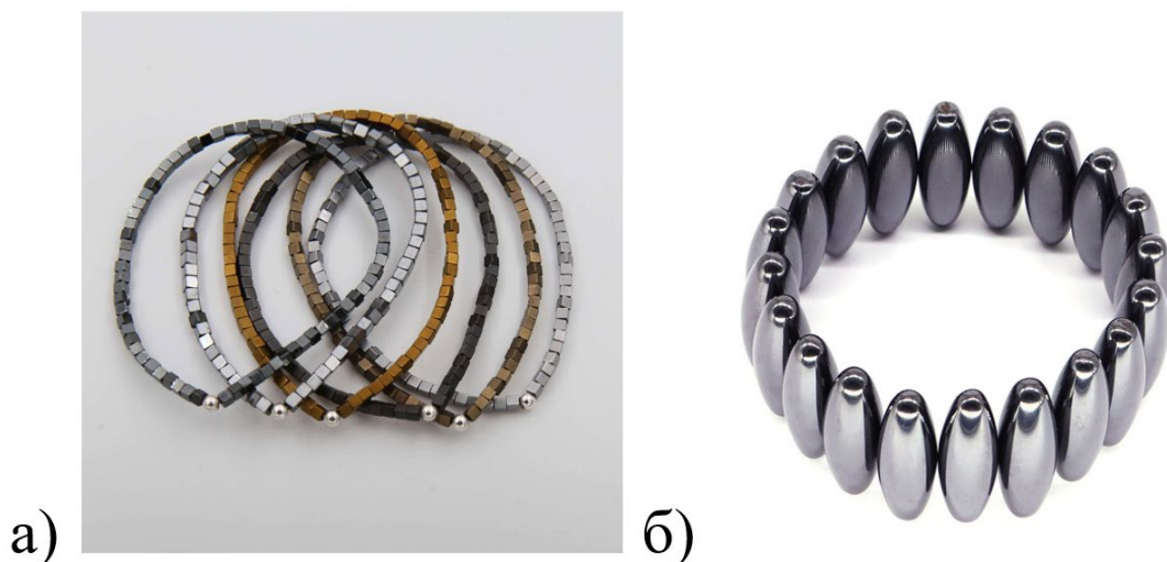
Рис. 1. Ювелирное изделие из гематита (а), магнетита (б)

Наиболее широкое применение (в том числе и для производства художественных изделий) находят сплавы железа, стали и чугуны. Так, углеродистые стали (содержащие железо, углерод и небольшое количество примесей) не отличаются красотой, коррозионной стойкостью, они практически не пригодны для использования в ювелирной промышленности, единственное назначение – вспомогательные цели. Так, углеродистые стали У8А, У10А (высококачественные стали с содержанием углерода 0,8 и