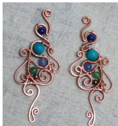
Рис. 7. Ювелирное украшение из бронзовой проволоки

Бронза – идеальный материал для создания памятников и скульптур, благодаря ее красивому внешнему виду, устойчивости к механическим и атмосферным воздействиям. Существует огромное количество памятников из литой бронзы. Среди них символ Санкт-Петербурга – легендарный «Медный всадник» – конный 10-метровый памятник первому