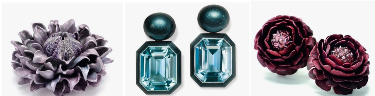
Рис. 11. Ювелирные украшения из алюминия (Hemmerle)

Мюнхенская компания Hemmerle, основанная в 1893 году братьями Антоном и Жозефом Хеммерле, выпускает украшения из нетрадиционных материалов, что является визитной карточкой данной компании. Кристиан Хеммерле, который возглавляет уже 4 поколение ювелирного дома, выбирает алюминий для создания ювелирных шедевров (рис. 11).