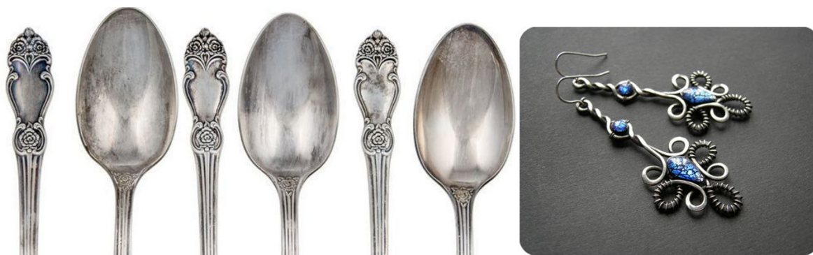
Рис. 10. Ювелирные украшения или столовые приборы из нейзильбера