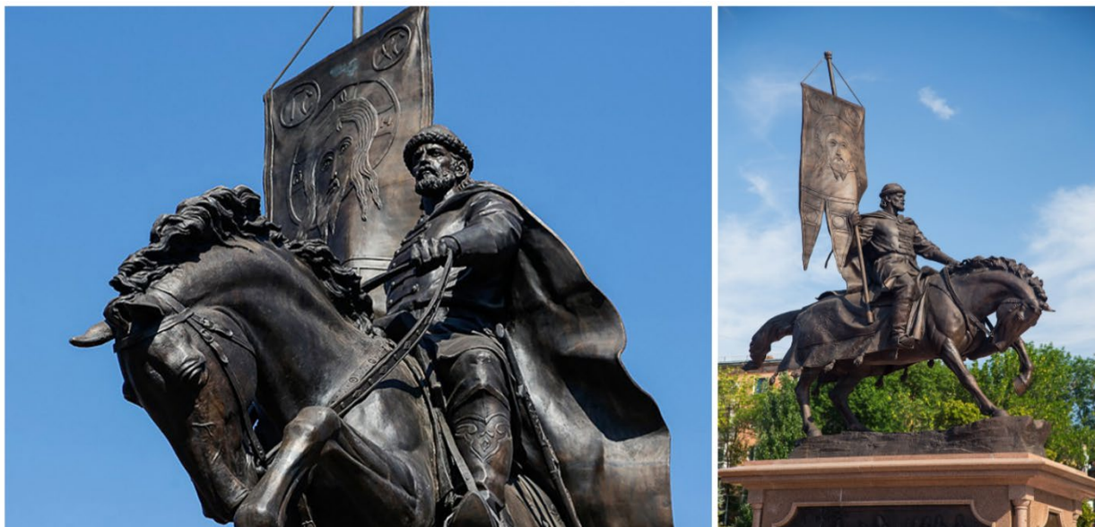
Рис. 8. Памятник основателю Самары – князю Г. Засекину, выполненный из бронзы

Мельхиор представляет собой сплав меди с никелем, в ряде случаев с добавками марганца и железа. Из этого сплава изготавливают