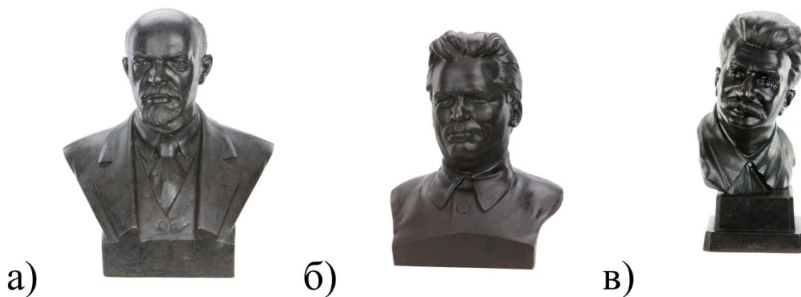
Рис. 4. Художественные изделия, изготовленные на Кусинском чугуноплавильном заводе: Бюст «В. И. Ленин» (а), Бюст «С. М. Киров» (б), Бюст «Портрет Сталина И. В.» (в)

постсоветский период интерес к художественному литью катастрофически упал, что сказалось и на производстве Кусинского завода. В 2004 году было ликвидировано оборудование для художественного литья, а с 2005 года завод прекратил выпуск художественной продукции.