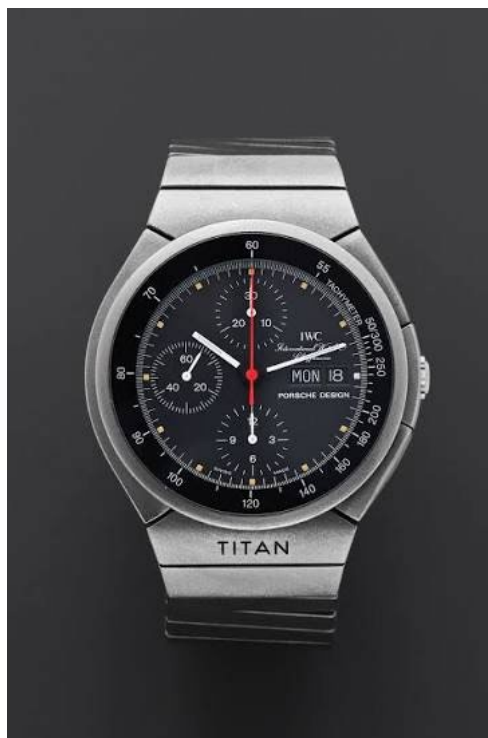
Рис. 12. Швейцарские часы из титана

Вольфрам и его сплавы. Вольфрам является наиболее тугоплавким и одним из самых твердых и тяжелых, но и достаточно хрупким металлом. В соединении с углеродом он превращается в карбид вольфрама - очень красивое, износостойкое соединение, по твердости