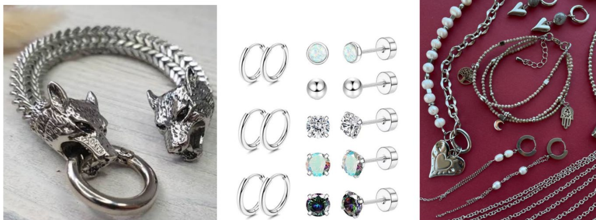
Рис. 2. Ювелирные украшения из коррозионностойкой (нержавеющей) стали

Наибольший интерес в производстве ювелирных изделий вызывают легированные стали (особенно с повышенным содержанием хрома и никеля, так называемые нержавеющие стали с маркировкой 18/10). Ассортимент таких украшений как мужских, так и женских весьма широк (рис. 2).