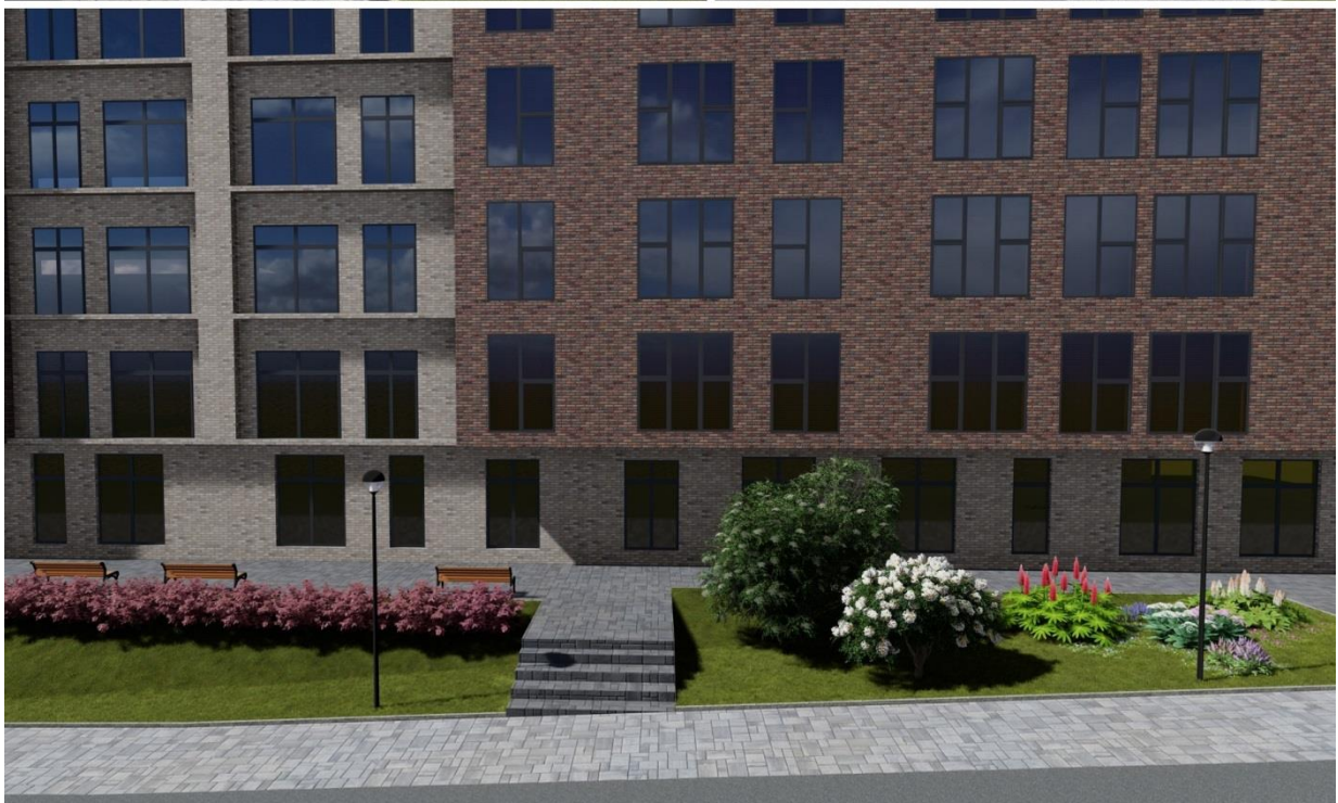
Рис. 3. Пример размещения растений в ландшафтной подзоне «Аллея историй»