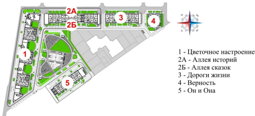
Рис. 1. Эскиз генерального плана жилого комплекса с выделением зеленых зон

территорию жилого комплекса решено было условно разделить на пять ландшафтных зон, логически перетекающих друг в друга, объединенных посредством дорожно-тропиночной сети, и сливающихся в общем центре (рис. 1).