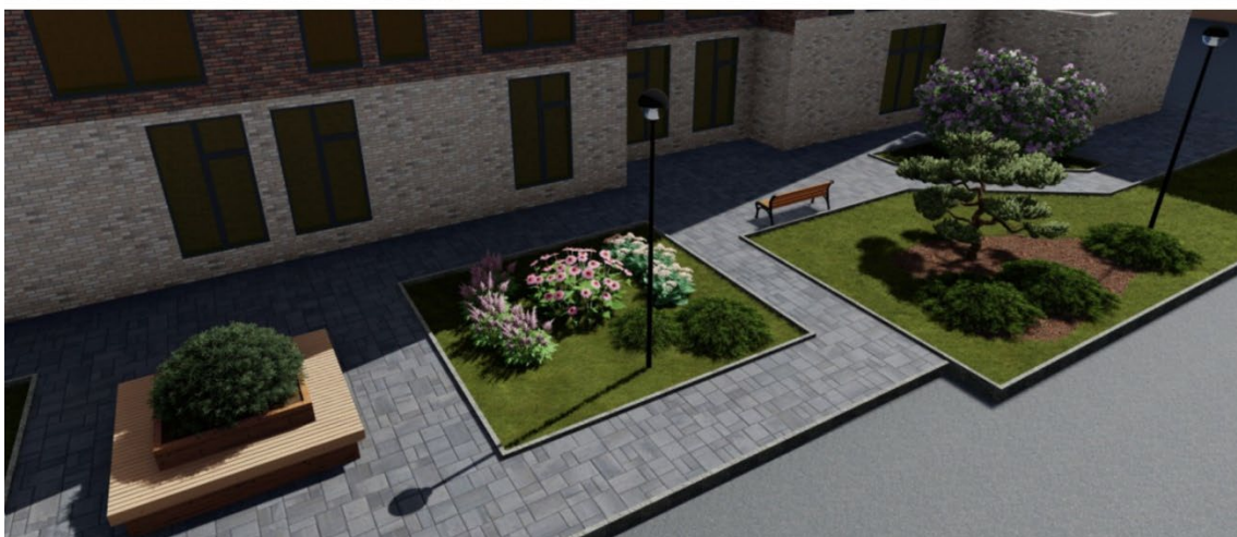
Рис. 2. Пример размещения растений в ландшафтной подзоне «Аллея сказок»