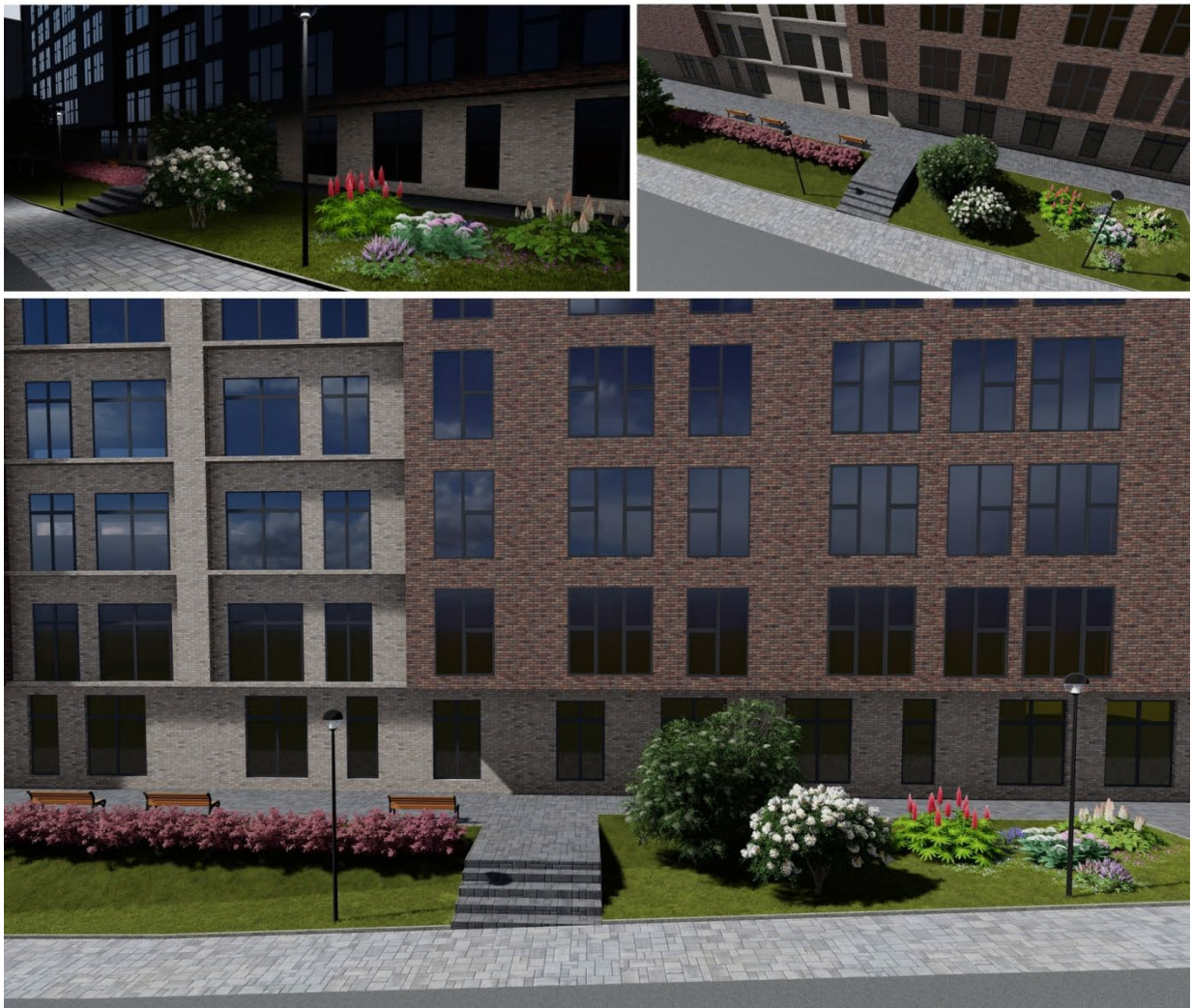
Рис. 3. Пример размещения растений в ландшафтной подзоне «Аллея историй»

Горячий чай, запах малинового варенья, утренняя прохлада и дымок топящейся печки, истории бабушки о минувшем, светлые воспоминания – эти счастливые моменты нашего детства нашли воплощение в дизайне Аллеи Историй. Здесь использованы нарочито консервативные, но такие близкие и знакомые формы и цвета – белые шары калины, яркие стрелы люпинов, романтичные остролистные клены.