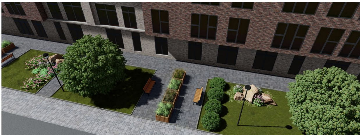
Рис. 4. Пример размещения растений в ландшафтной зоне «Дороги жизни»