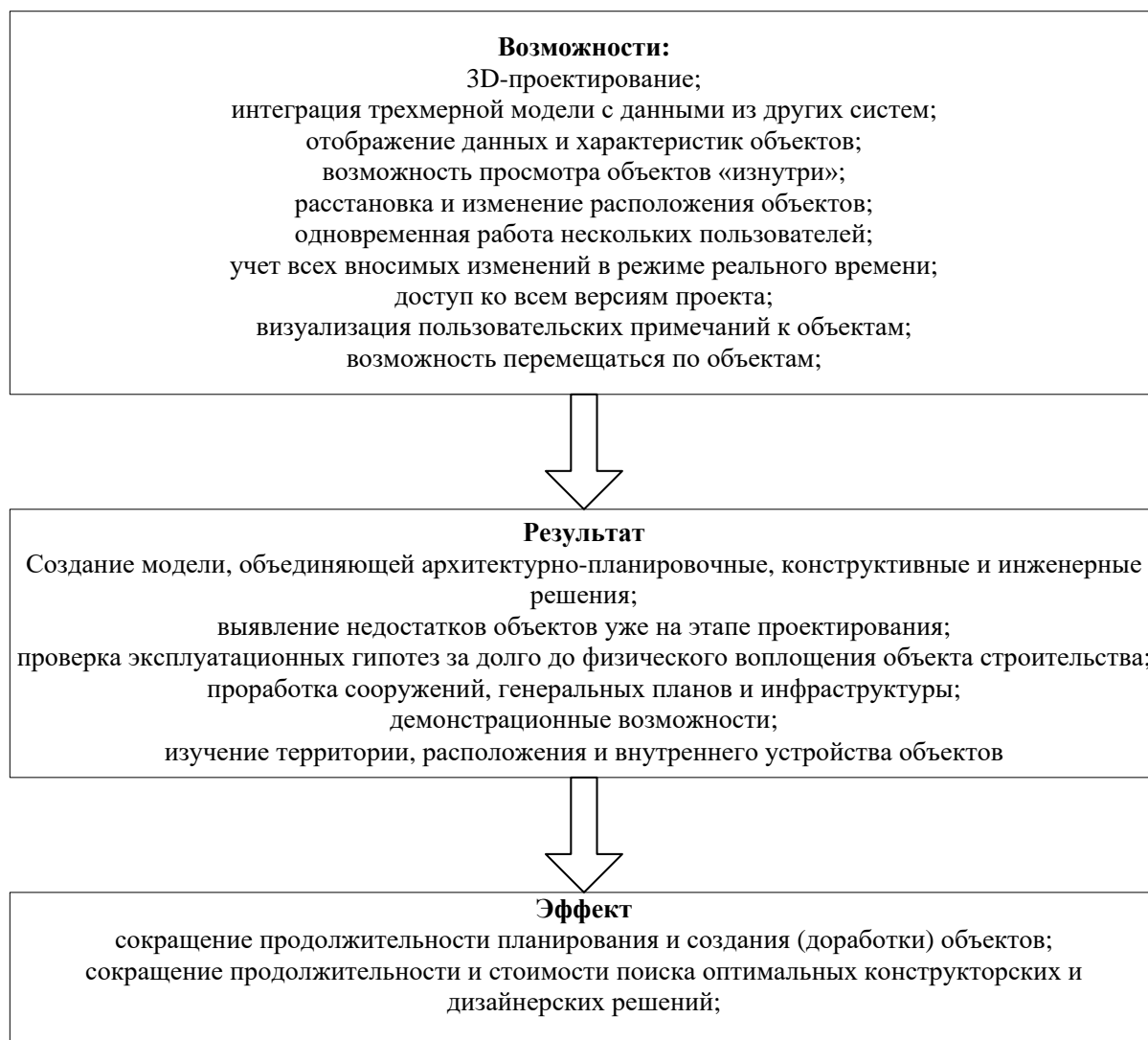
Рис. 1. Результаты применения VR в образовательном процессе вуза

С опорой на исследования [2], анализ учебных планов подготовки специалистов в области строительства с учетом квалификационных характеристик специальности позволяют сформулировать ряд принципов использования технологий виртуальной реальности, направленных на формирование профессиональных компетенций: