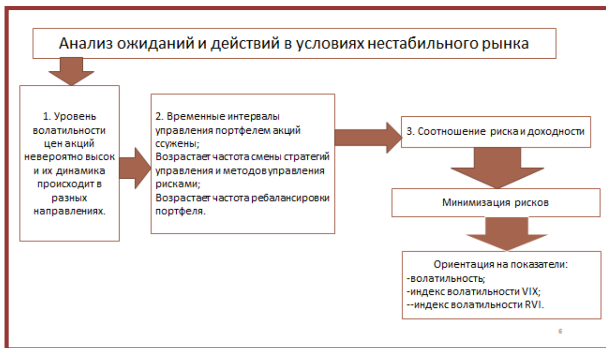
Рис. Анализ ожиданий и действий инвестора в условиях нестабильного рынка

Далее основная цель инвестора – минимизация рисков. В данном случае риски можно минимизировать путем отслеживания показателя волатильности, индекса волатильности VIX и индекса волатильности RVI.