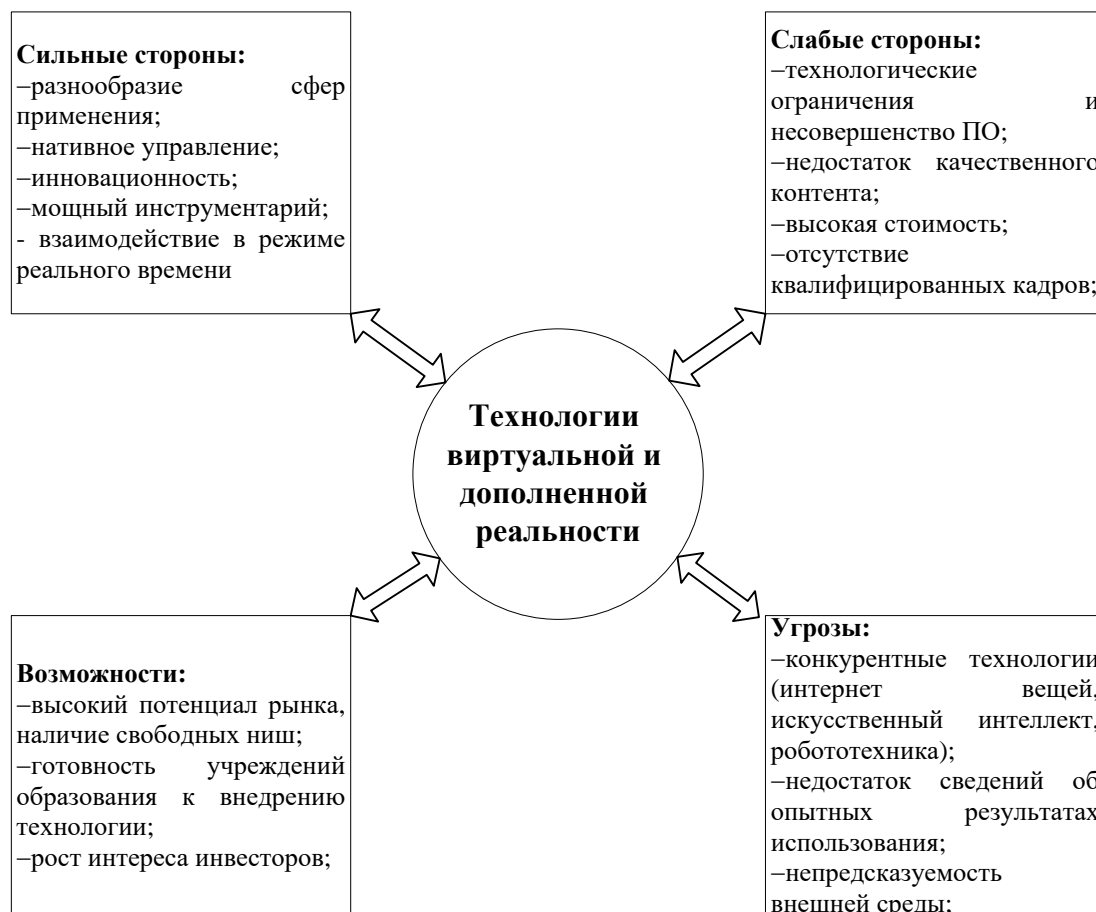
Рис. 2. SWOT-анализ применения технологий дополненной и виртуальной реальности в образовательном процессе вуза

– Принцип вариативности заданий , позволяющий глубже осваивать технологии виртуальной реальности и понимать их возможности в решении задач практической профессиональной направленности. Указанный принцип позволяет расширить представление о технологиях виртуальной реальности, об их возможностях, как в учебной, так, и в профессиональной деятельности.