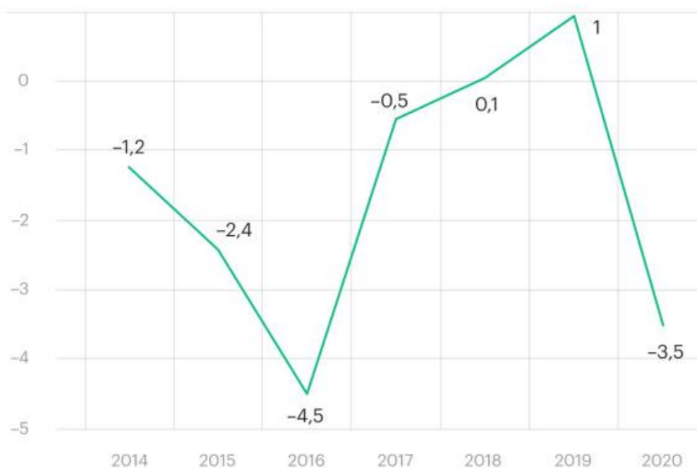
Рис. 2. Динамика реальных располагаемых денежных доходов россиян.